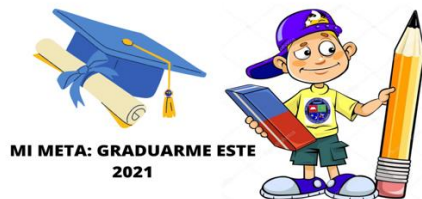
Ilustración 1 Noción de tiempo y espacio | Niños escolares, Caratula para niños, Niños. Imágenes adaptadas de Google por Celene Gallego Castrillón 2021