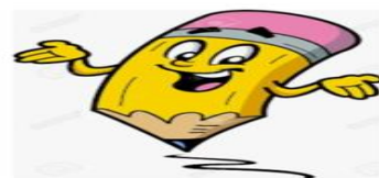
Ilustración 2 Pin de | en muñecos varios | Imágenes de lápices animados, Imágenes de lápiz, Imágenes de profesores